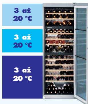
Abb. WTes 4677