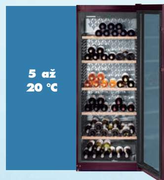
Abb. WK 4677

Pro dlouhodobé skladování větších zásob vína jsou klimatizované vinotéky tou ideální volbou. V klimatizovaných vinotékách od firmy Liebherr můžete pro optimální zrání skladovat vína dlouhodobě. Podle nastavené teploty však zde můžete také udržovat bílá nebo červená vína v zásobě v příslušné teplotě pro servírování.